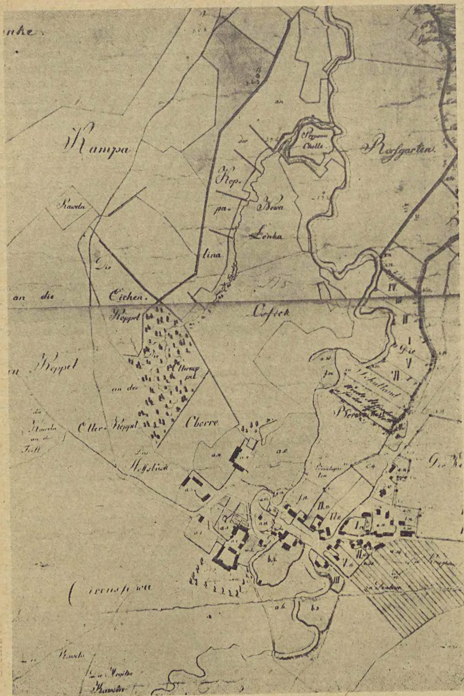
Ryc. 3. Plan wsi Bolszewo z r. 1820 z nazwą Osiek na polach wsi.