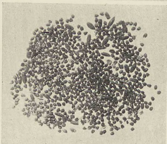
Bonikowo. Ziarna zbóż z warstwy IV