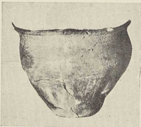
Bonikowo. Naczynie gliniane z warstwy III