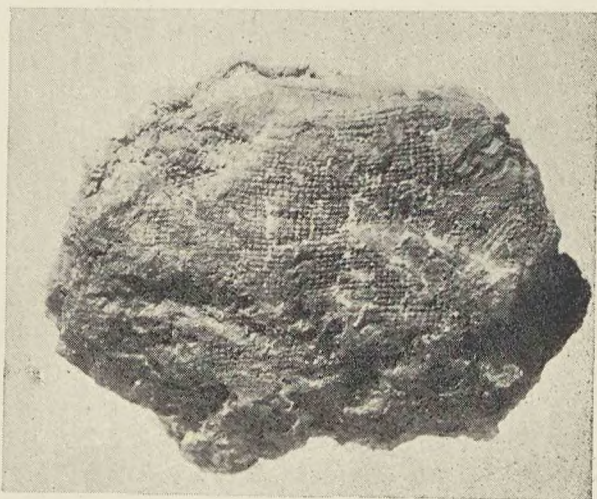
Bonikowo. Fragment polepy z odciskiem tkaniny