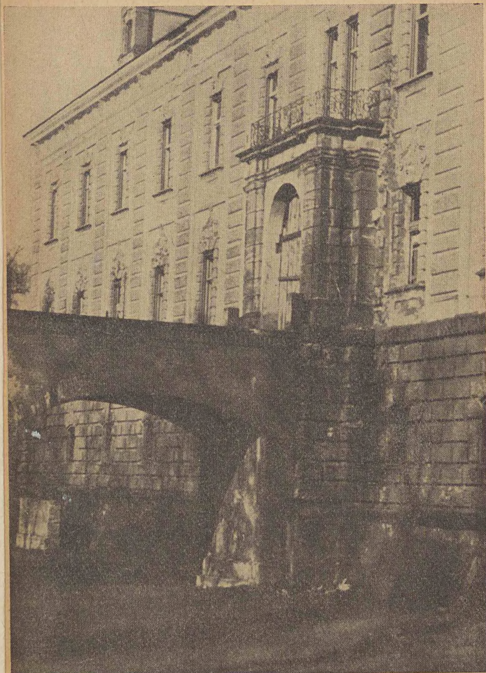
ZAGAŃ. BAROKOWY ZAMEK Z XVII W.