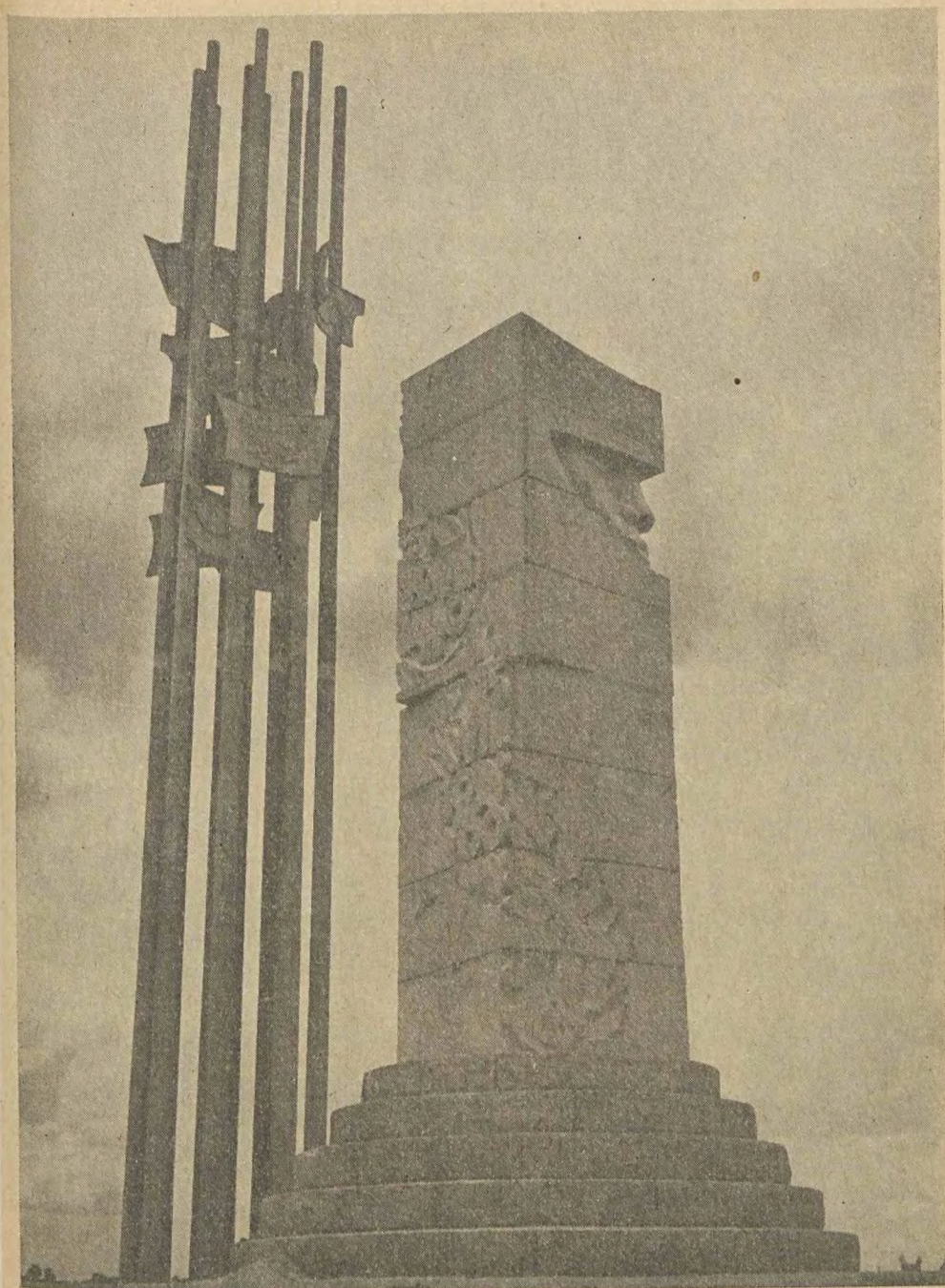
POMNIK GRUNWALDZKI ODŚLONIĘTY NA POLU BITWY W DNIU 15 VII 1960 R.