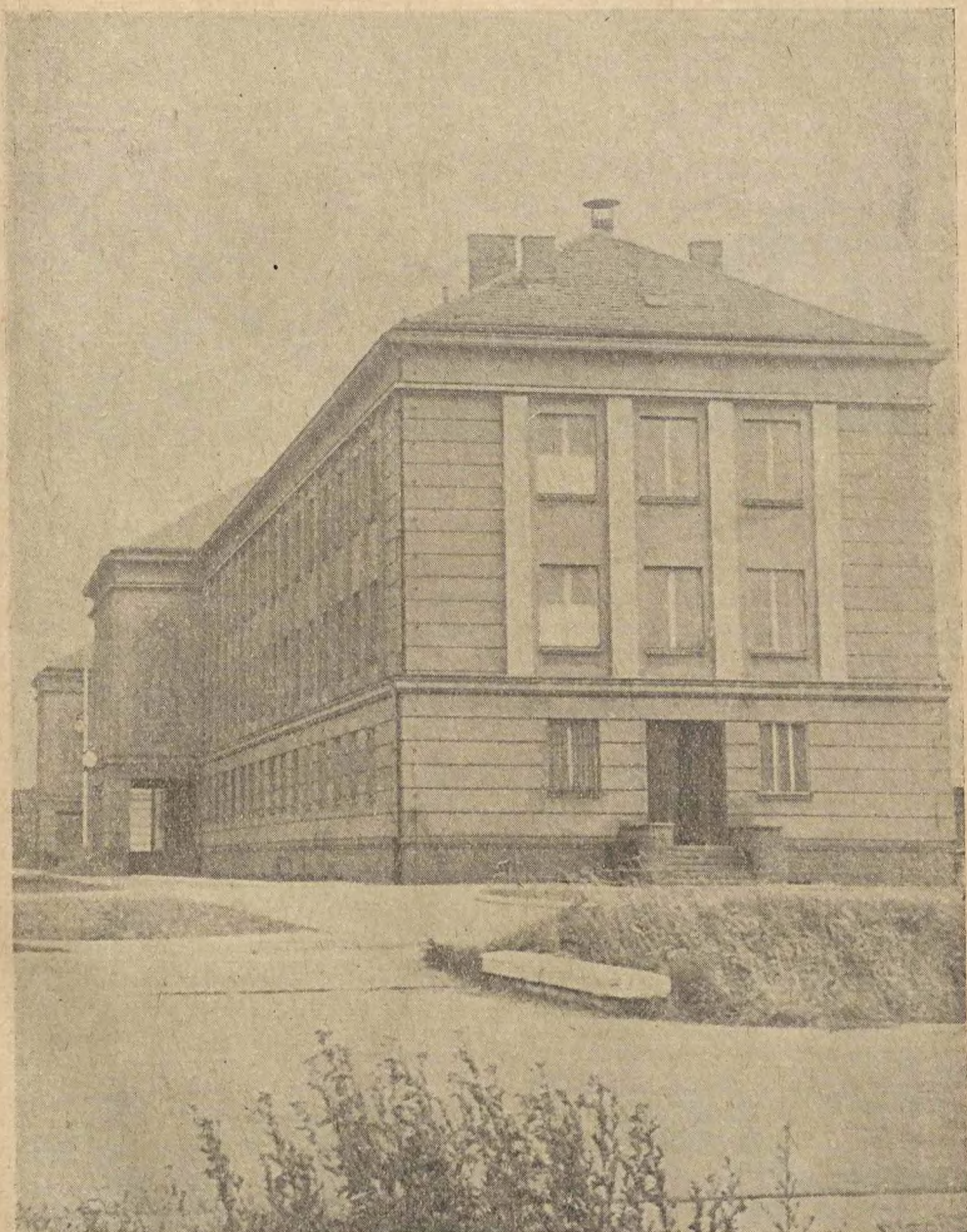
„DOM HUTNIKA“ PRZY LEGNICKIEJ HUCIE MIEDZI