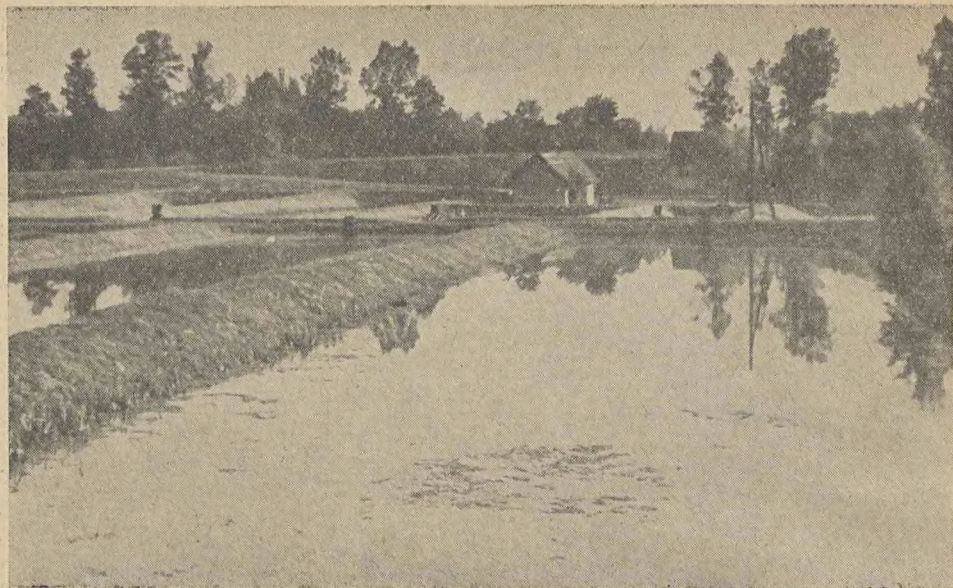
U GÓRY: STAWY HODOWLANE W ZABOROWCU W WOJ. ZIELONOGÓRSKIM. U DOŁU: FERMA DROBIU KÓŁKA ROLNICZEGO W BOGUSŁAWICACH KOŁO WROCŁAWIA