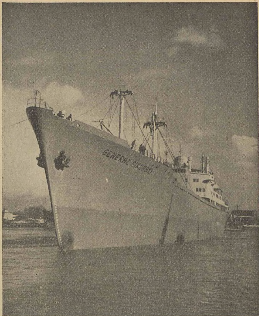
ZBUDOWANY W STOCZNI GDAŃSKIEJ STATEK „GENERAL SIKORSKI“