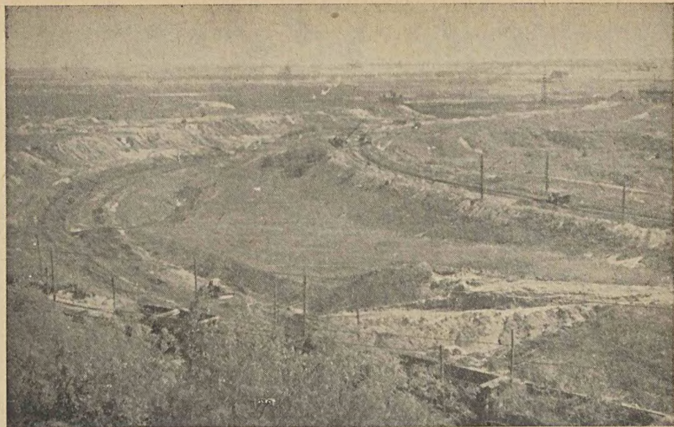
BITTERFELD. KOPALNIE ODKRYWKOWE WĘGLA BRUNATNEGO