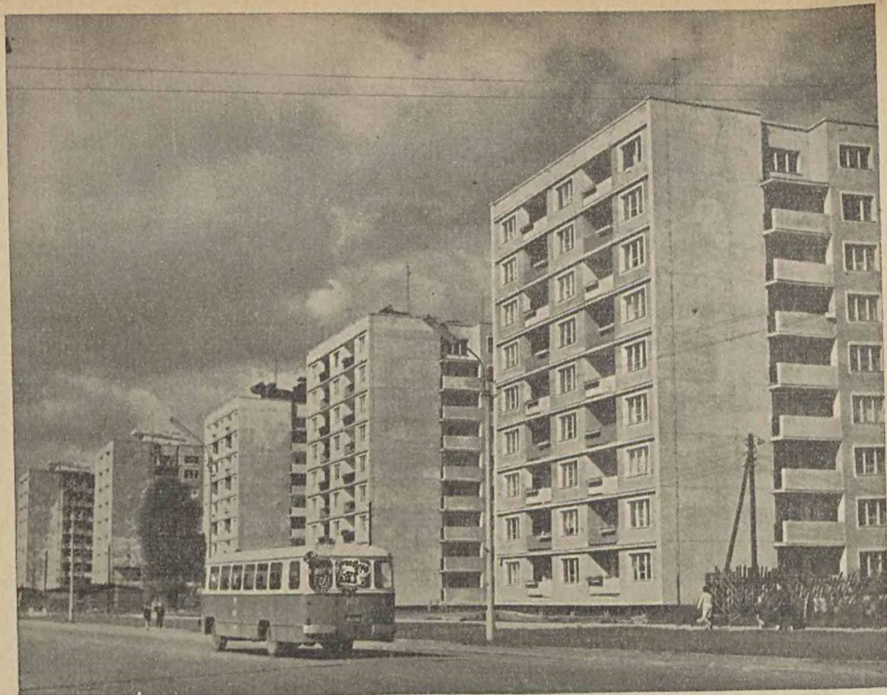
ELBLĄG. NOWOCZESNE BUDOWNICTWO PRZY ULICY 1000-LECIA