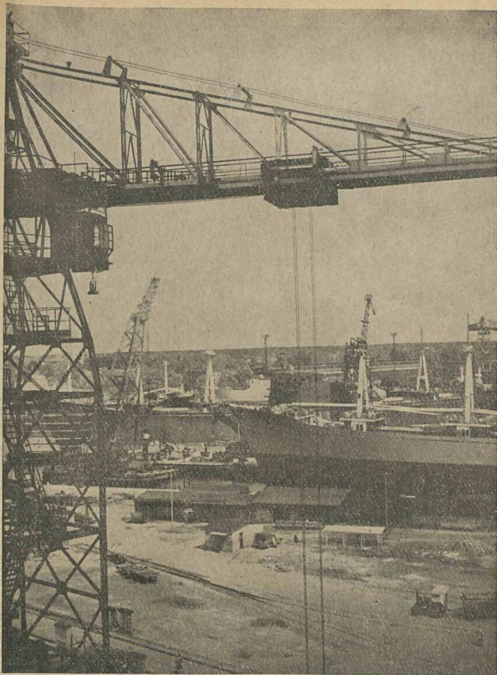
TEGOROCZNE „DNI MORZA” MIAŁY CHARAKTER JUBILEUSZOWY. NA ZDJĘCIU: STOCZNIA GDAŃSKA.